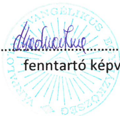
..... fenntartó képviselője

----- A Forrás Evangélikus Keresztény Óvoda Szervezeti és Működési Szabályzatát a fenntartó presbitérium ..... 2/2024 ..... számú ..... 2024. 01. 10. .....-n kelt határozatával jóváhagyta.